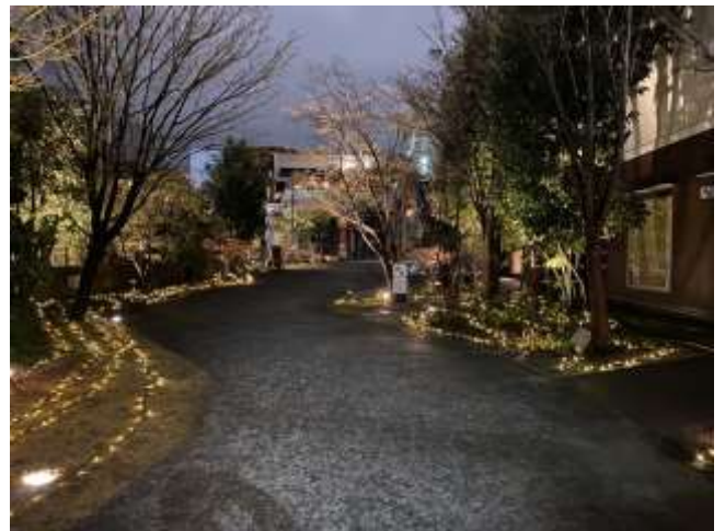
今回使用した画像は福岡です。